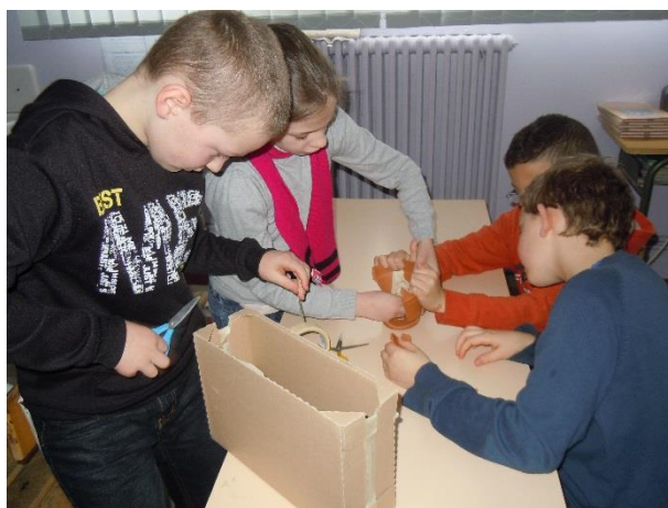
Atelier « reconstitue ton vase antique »