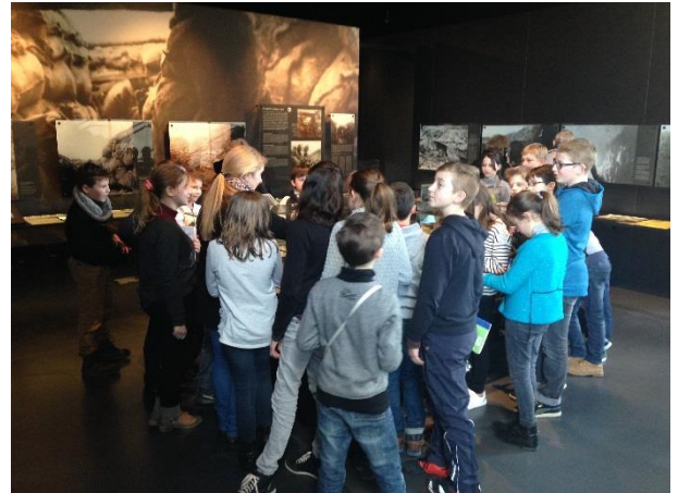
Visite au Lens'14-18 Centre d'Histoire Guerre et Paix