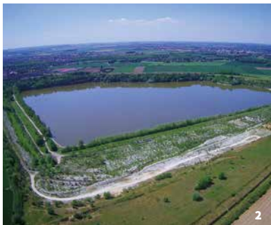
1. Maquette de l'ancienne cokerie de Drocourt

Tarif : Gratuit - Renseignements au 06 75 53 13 88